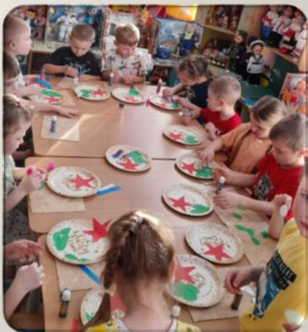
Аппликация «Открытка для папы»