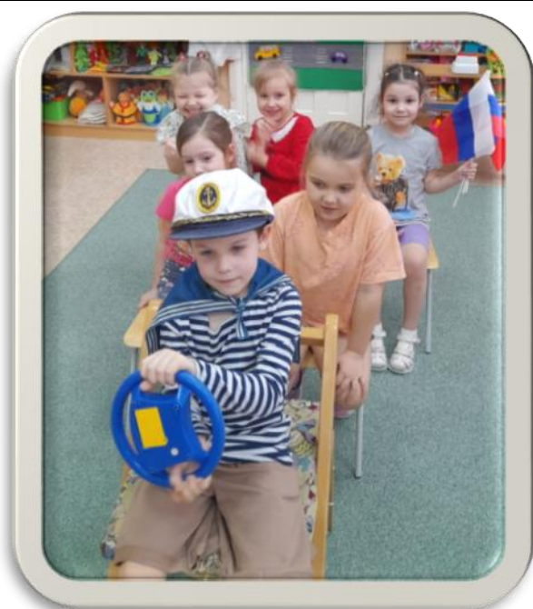
Сюжетно ролевая игра