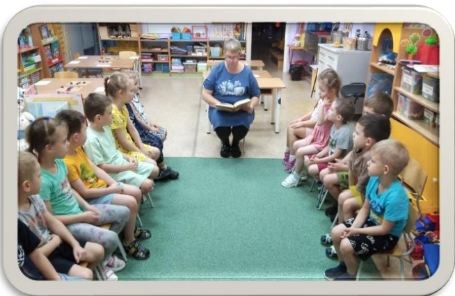
Чтение художественной литературы