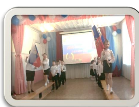
Музыкально спортивный праздник.