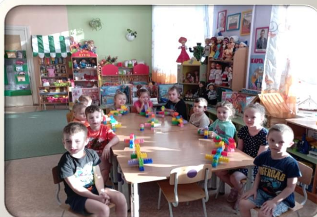
Конструирование из Лего