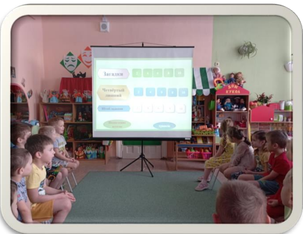
Интерактивная игра «Своя игра»