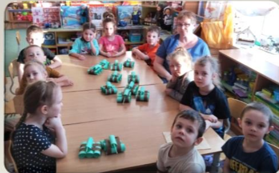
Конструирование из цилиндров «Танк»